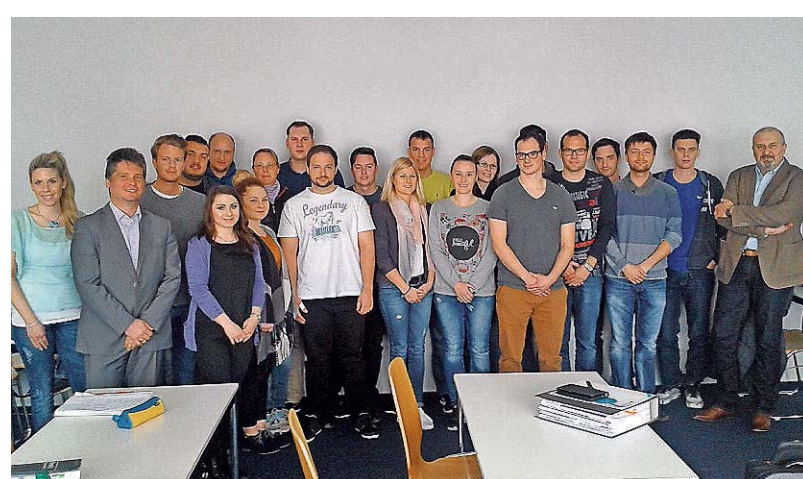
Studenten des Mittelstandsmanagements sowie des Logistik- und Produktionsmanagements mit ihren Dozenten.

Der Vortrag endete mit der transparenten Darstellung der noch unerschlossenen Potentiale