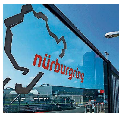
Vorlesungstage der HS am Nürburgring.

• Interessenten für die diese beiden innovativen Studiengänge können sich über die Website http://ving.bw.fh-kl.de/mba-motorsport-management/ oder direkt bei www.ed-media.org informieren.